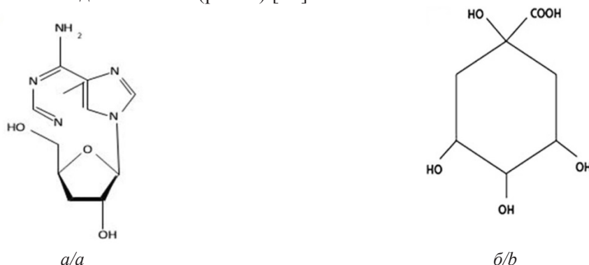
Рис. 2. Структурная формула кордицепина (а) и кордицепиновой кислоты (б) [30]

Кордицепиновая кислота (изомер хининовой кислоты) является одним из главных действующих лекарственных веществ, выделенных из гриба C. sinensis . Кордицепиновая кислота идентифицирована, как D-маннитол. По химическому строению маннитол является спиртом и сахаром, или полиолом, подобен ксилиту и сорбиту, широко используется в медицине и пищевой промышленности. Содержание маннитола в плодовых телах C. sinensis составляет 29–85 мг/г. Содержание маннитола в мицелии C. sinensis выше, чем в плодовых телах (рис. 2) [38].