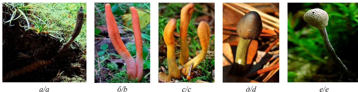
Рис. 1. Грибы рода Cordyceps : а) китайский ( C. sinensis ), б) военный ( C. militaris ), в) офиоглоссовидный ( C. ophioglossoides ), д) бугорчатый ( C. capitata ), е) серо-пепельный ( C. entomorrhiza )